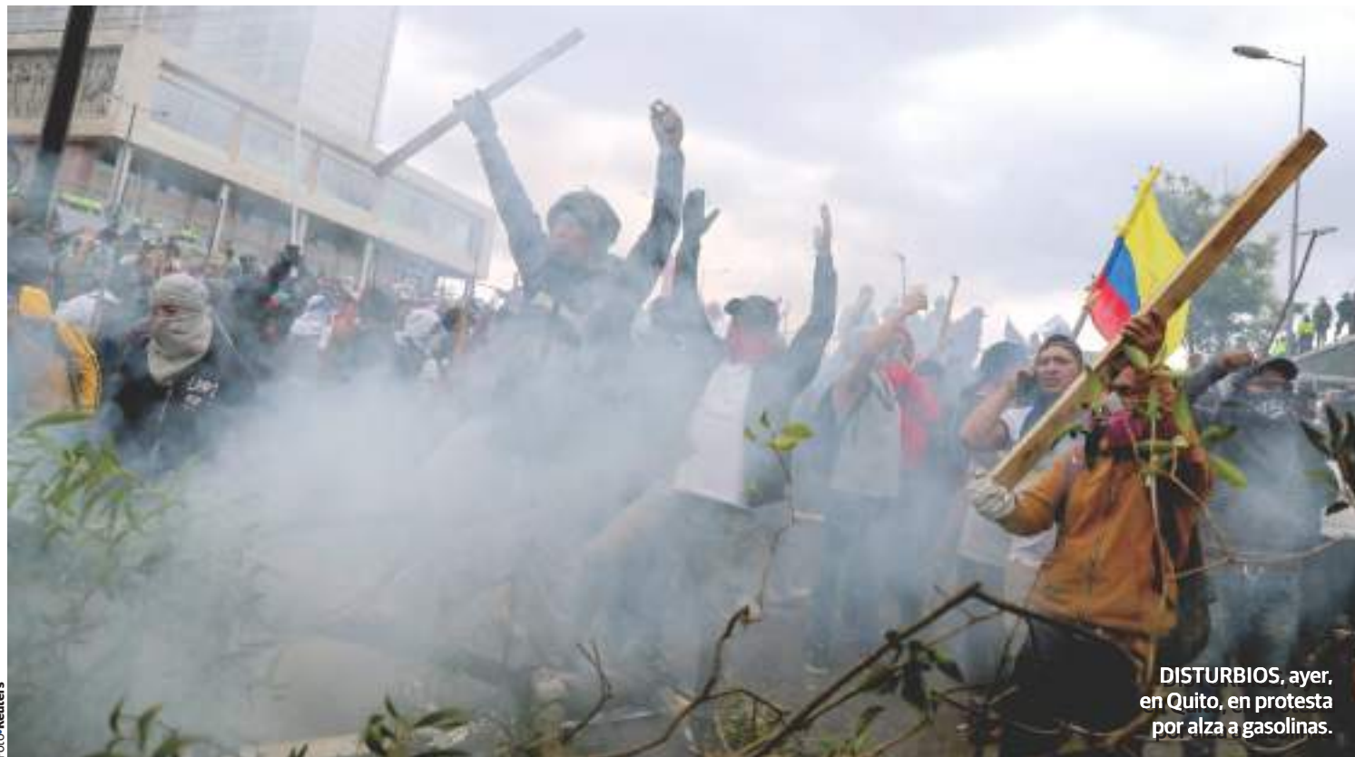
DISTURBIOS , ayer, en Quito, en protesta por alza a gasolinas.

Un muerto y 500 detenidos por choques entre manifestantes que rechazan gasolinazo y fuerzas de seguridad; inconformes toman el Congreso, pero soldados los repelen; decretan toque de queda por estallido social; 7 países condenan intento desestabilizador del chavista en la región. pág. 21