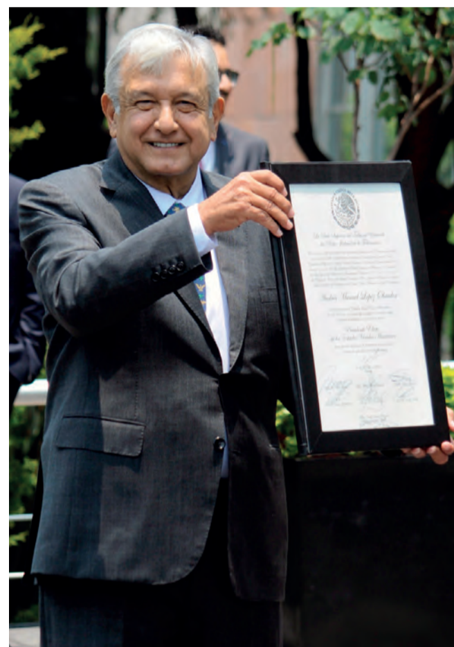
ANDRÉS MANUEL López Obrador, ayer.

MEXICANOS , hartos de influen-tismo, deshonestidad e ineficiencia, acusa; en el TEPJF ofrece ser fiel a la voluntad del pueblo pág. 3