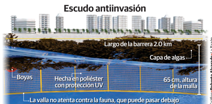
Gráfico: Roberto Alvarado/La Razón

»Buscan frenar avance de las algas que amenazan equilibrio ambiental y económico, antes de que lleguen a las playas; el plan piloto es Punta Nizuc, después, Puerto Morelos... pág. 8