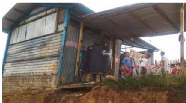
SALÓN de lámina en una primaria de la región Iloxicha.

“La Sección 22 desinforma a padres de familia y muchos que no conocen los programas les creen”