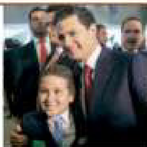
EL MANDATARIO , ayer, en la 59 Semana Nacional de la CITE.