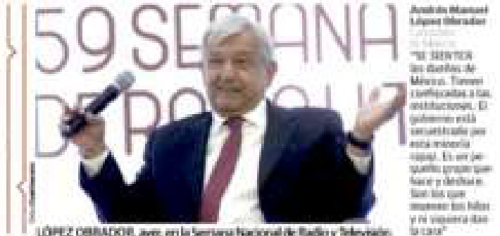
LÓPEZ OBRADOR, ayer, en la Semana Nacional de Radio y Televisión.

"UNA CAMPAÑA basada en falsedades y desinformación afrente la conciencia de los mexicanos, y detestamos la expectativa de poner en la construcción de una sólida democracia"