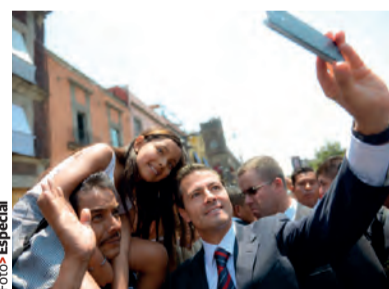
EL MANDATARIO, ayer, al caminar por el Centro Histórico.

“NOS HEMOS venido conduciendo en una mesa de acuerdo, de negociación, y espero que se mantenga ese espíritu propositivo, de respeto mutuo y de cordialidad”