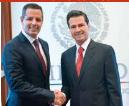
Alejandro Murat Hinojosa

Estado: Oaxaca | Coalición: PRI-PVEM-Panal