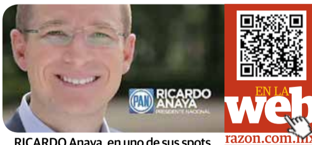
RICARDO Anaya, en uno de sus spots.

LOS MAGISTRADOS del tribunal electoral descartan que el líder nacional del PAN haya incurrido en actos anticipados de campaña pág. 3