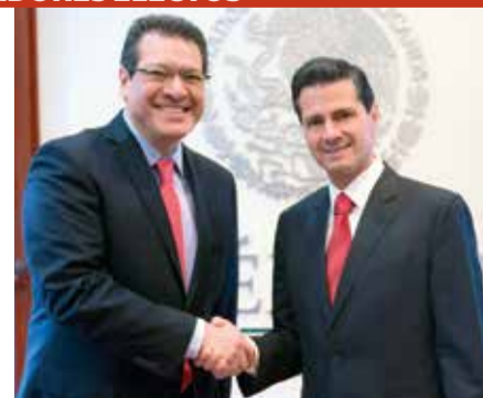
Marco Antonio Mena

Estado: Oaxaca | Coalición: PRI-PVEM-Panal