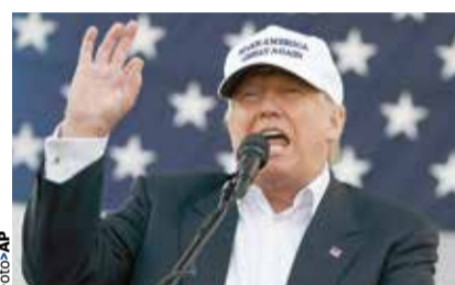
DONALD TRUMP en Miami, ayer.

Mercados, en vilo ante último jalón de Trump