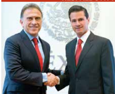
Miguel Ángel Yunes