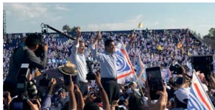
RICARDO ANAYA, en un mitin en Celaya, ayer.

El banderado de Por México al Frente señala que el país debe tener ante su vecino una posición de firmeza y dignidad; encabeza mítines en Guanajuato y Jalisco. pág. 7