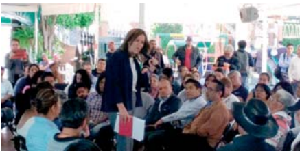
MARGARITA ZAVALA, ayer en una reunión en Ecatepec.

La aspirante independiente dialogó con familiares de víctimas de este delito en el Estado de México; ofrece crear un sistema nacional de policías. pág. 7