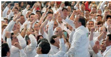
JOSÉ A. MEADE, ayer, en su arranque en Mérida.

Ante 60 mil personas, en vivo o conectados, el candidato del PRI afirma en Yucatán que será el primero en gobernar sin fuero; arremete contra falsas promesas. pág. 6