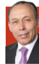
José Reyes Baeza Director del ISSSTE

» El director del ISSSTE dice a La Razón que sólo con campañas atractivas se podrá incidir; destaca ahorros por 3 mil 200 mdp en compra de medicinas y 2 mil mdp más en su suministro págs. 8 y 9