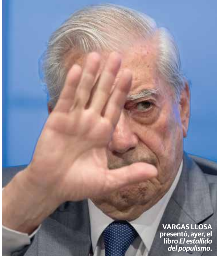
VARGAS LLOSA presentó, ayer, el libro El estallido del populismo .

EL ESCRITOR MARIO VARGAS LLOSA advierte que ese sistema arruina económicamente a los países, luego de un breve periodo en el que políticas demagógicas seducen a la población con una aparente bonanza; "en sus raíces siempre está su superioridad sobre otros sistemas y no admite críticas", dice en Madrid. pág. 20