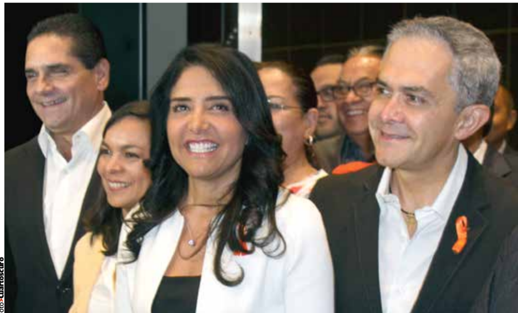
ALEJANDRA Barrales y Miguel Mancera, ayer; a la izquierda, Silvano Aureoles y Beatriz Mojica.

LLAMARÁN a académicos, IP, sociedad...; puede ser una nueva manera de hacer política, dice el Jefe de Gobierno