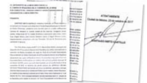
El extitular de FEPADE envió una carta a los senadores en la que acepta comparecer.