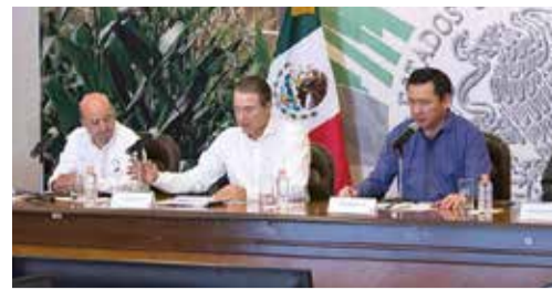
OSORIO (der.), ayer, en Sinaloa; le acompaña Renato Sales (izq.).

El secretario de Gobernación rechaza que exista algún tipo de espionaje cibernético contra comunicadores y activistas; pide denunciar ante la PGR para que se pueda abrir una indagatoria; acude a Sinaloa para supervisar las acciones de seguridad con autoridades estatales; llama a redoblar esfuerzos. pág. 9