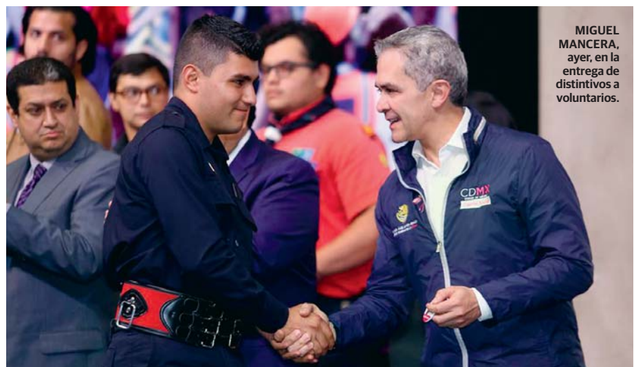
MIGUEL MANCERA, ayer, en la entrega de distintivos a voluntarios.

“No es un problema de recursos, el Estado los tiene, es un asunto de reto. Hay recursos, están hechas las provisiones y habrá más en partidas del próximo presupuesto”