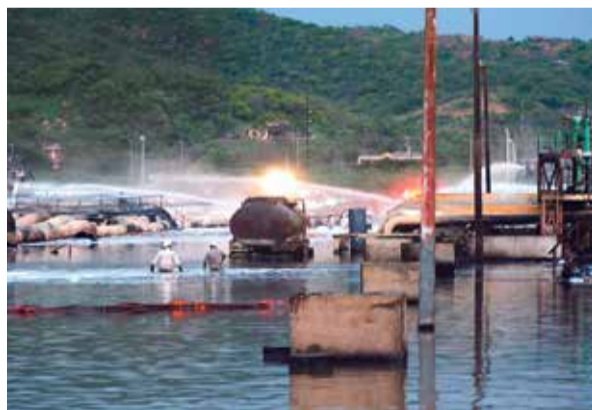
PERSONAL de contra incendios de la petrolera, ayer.

El director de Pemex y el gobernador de Oaxaca supervisaron las labores de emergencia, en coordinación con las Fuerzas Armadas; hubo 9 trabajadores lesionados que ayer fueron dados de alta. pág. 8