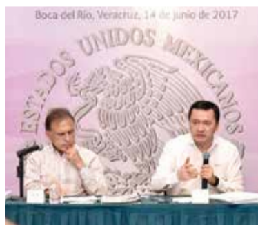
EL JEFE de la política interna del país (der.), ayer, en Veracruz.

El secretario de Gobernación acudió a la entidad para atender recomendaciones de la CNDH; "esto no es de ideologías, sino de erradicar toda violencia contra las mujeres", afirmó. pág. 10