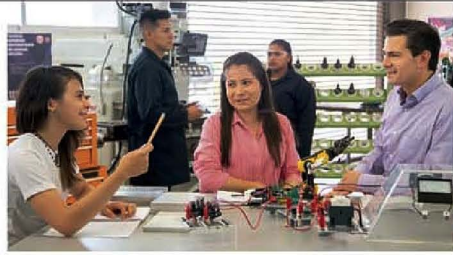
EL MANDATARIO con estudiantes, ayer.

El Presidente resalta nivel mundial y de alta especialización de la institución de la que ya se graduó la primera generación de ingenieros; más de la mitad de sus 776 alumnos están becados. pág. 8