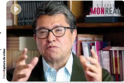
RICARDO Monreal, en video que difundió ayer en redes sociales.

» El jefe delegacional en Cuauhtémoc afirma a La Razón que su encuentro con el dirigente de Morena fue sólo el primero, y que tendrá más; afirma que escuchó propuestas y que revisa sus opciones; "por lo pronto me quedo en la delegación", dice pág. 12