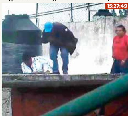
Ocho minutos después los delincuentes descienden hacia el edificio con las bolsas.