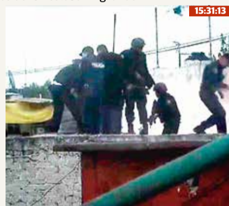
Llegan los policías y entran por el mismo agujero para seguirles la pista.