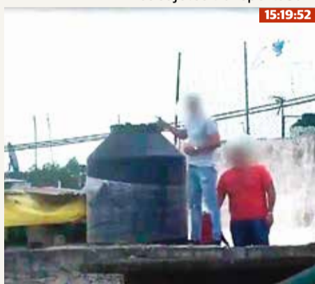
Momento en que sacan paquetes de droga por un hueco que está en el techo de una vecindad.

Los sujetos transportaban la droga de una bodega a otra sin saber que cámaras del C4 estaban vigilando.