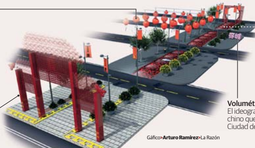
Gáfico • Arturo Ramírez • La Razón

Entrada En tonos rojos decorada con elementos de la cultura oriental, como dragones