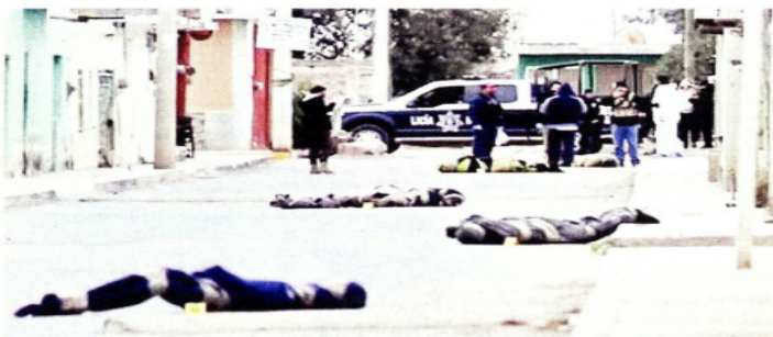
En calles de Fresnillo, Zacatecas, fueron tirados 10 cuerpos envueltos en cobijas.

La Jefa de Gobierno, Claudia Sheinbaum, detalló que la reducción prevista para la CDMX equivale a poco más del 50 por ciento del abasto regular. Se implementó la distribución de agua con pipas en Álvaro Obregón, Benito Juárez, Coyoacán, Iztapalapa, Magdalena Contreras y Tlalpan. La reducción afectará también a 11 municipios del Edomex.