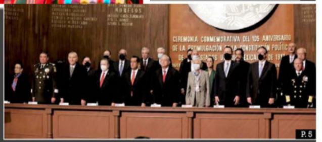
CEREMONIA COMEMORATIVA DEL 105 ANIVERSARIO DE LA PROMULGACIÓN DE LA CONSTITUCIÓN POLÍTICA DE LOS ESTADOS UNIDOS MEXICANOS DE 1917

Commemoración del 105 aniversario de la Constitución de 1917