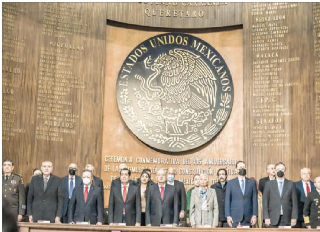
▲ El presidente Andrés Manuel López Obrador encabezó la ceremonia en el Teatro de la República acompañado por miembros de su gabinete, gobernadores y representantes de los poderes Legislativo y

Conmemoran en Querétaro 105 años de la Constitución