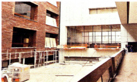
Los trabajos en la fachada del edificio H están en curso.

Sin antecedentes importantes de obra en edificios gubernamentales, al iniciar la 64 Legislatura, con la mayoría de Morena, la empresa obtuvo el contrato tan sólo para el retiro del material da-