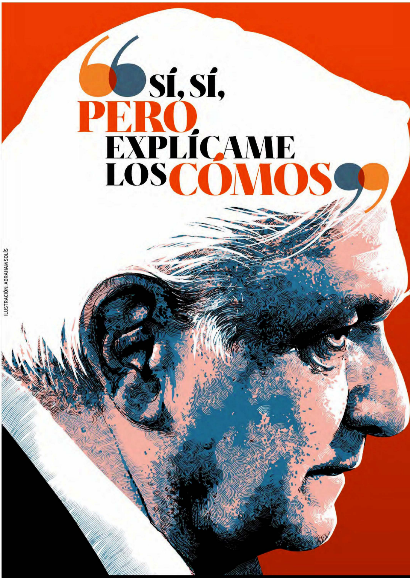
ILUSTRACIÓN: ABRAHAM SOLÍS