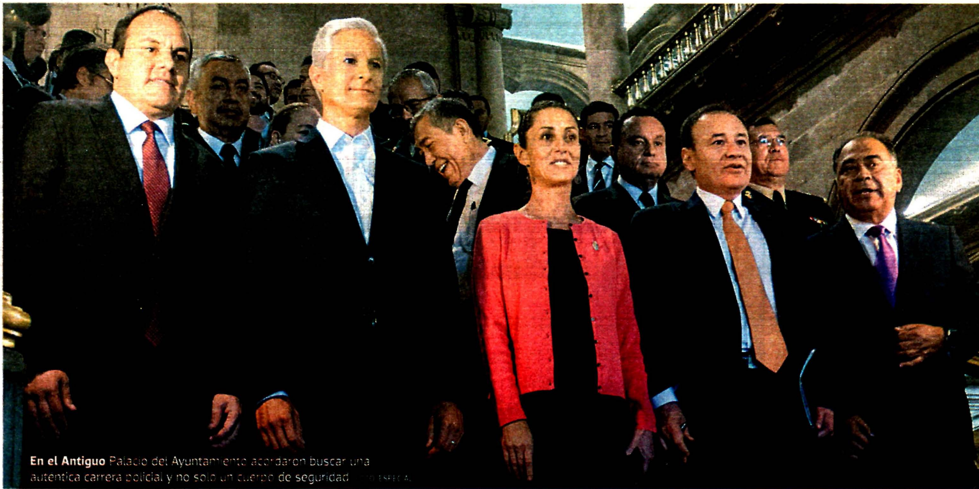
En el Antiguo Palacio del Ayuntamiento acordaron buscar una auténtica carrera policial y no solo un cuerpo de seguridad.

PRESENTA ALFONSO DURAZO ANTE GOBERNADORES DEL CENTRO DEL PAÍS EL MODELO NACIONAL DE POLICÍAS PÁG. 3