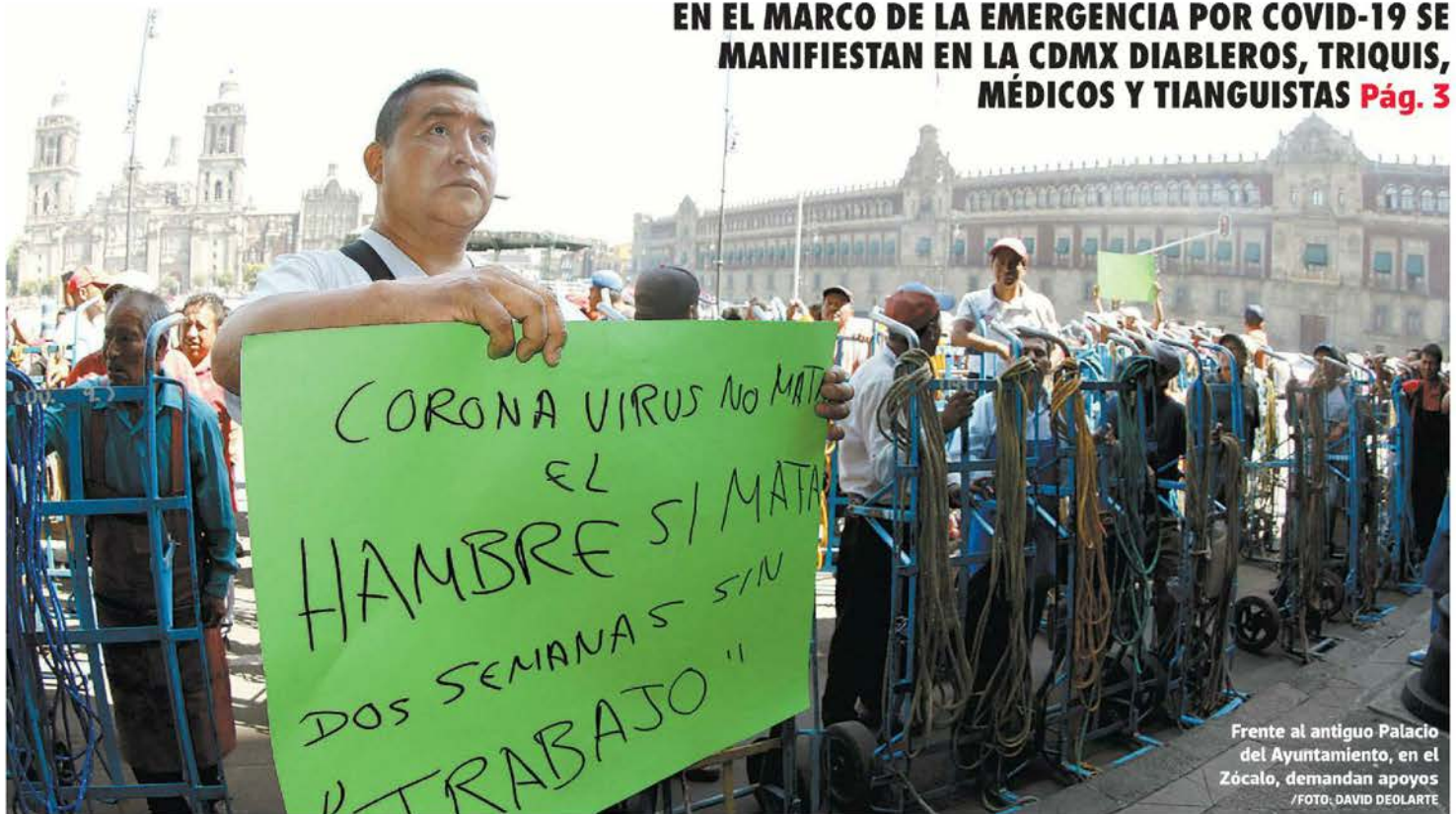
Frente al antiguo Palacio del Ayuntamiento, en el Zócalo, demandan apoyos

EN EL MARCO DE LA EMERGENCIA POR COVID-19 SE MANIFIESTAN EN LA CDMX DIABLEROS, TRIQUIS, MÉDICOS Y TIANGUISTAS Pág. 3