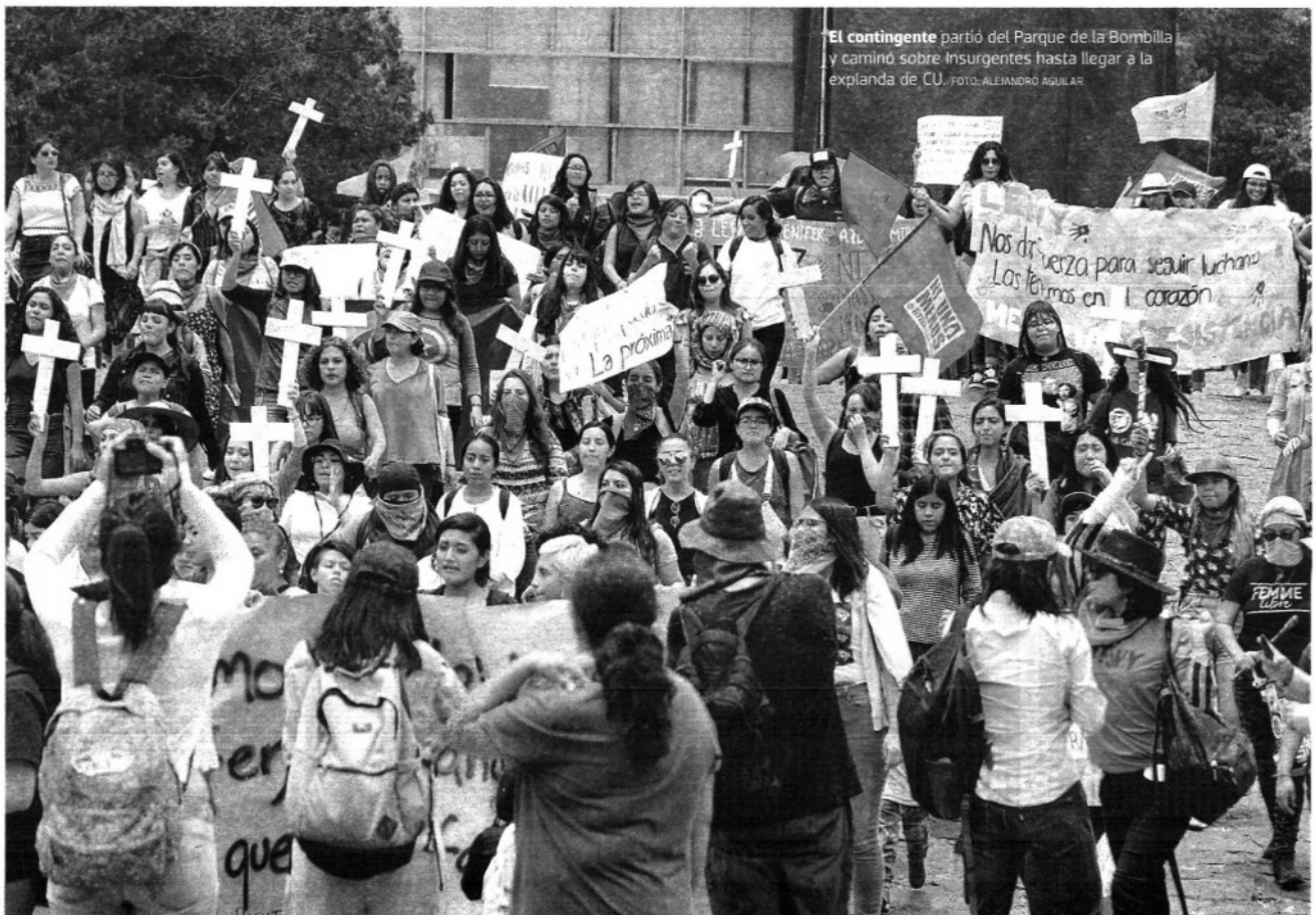
El contingente partió del Parque de la Bombilla y caminó sobre Insurgentes hasta llegar a la explanada de CU.