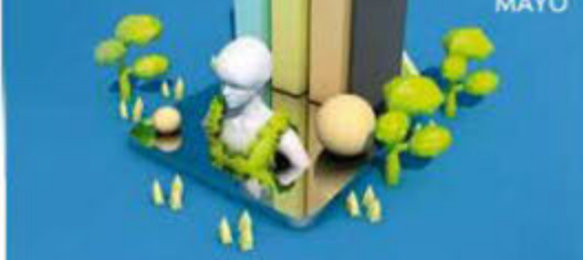
GRÁFICO: ARTURO RAMÍREZ