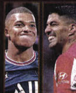
Kylian Mbappé. Luis Suárez.

Con la llegada del Año Nuevo, varios de los mejores futbolistas del mundo tienen la opción de negociar sus próximos contratos.