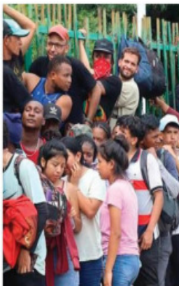
El problema crece y crece.

La Comar, que depende de la Secretaría de Gobernación, recibió casi 75,000 solicitudes de asilo en el primer semestre del año y espera cerrar con una cifra inédita de 150,000, según