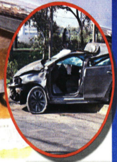
FRANCISCO RODRIGUEZ. EL GRÁFICO