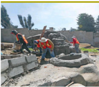
JORGE ALVARADO/EL UNIVERSAL