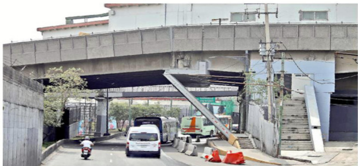
El Gobierno capitalino realiza obras de mitigación para contrarrestar el hundimiento