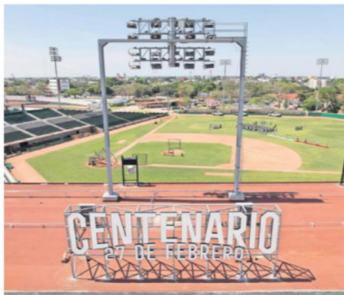
LIMA LÓPEZ, EL UNIVERSAL