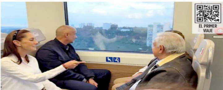
López Obrador hizo el primer viaje junto con la Presidente electa, Claudia Sheinbaum.