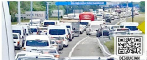
Las protestas afectaron a los viajeros que iban al aeropuerto.