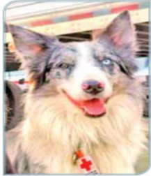
BALAM (HIJO) ESTÁ ACTIVO Junto con su hermano ha rescatado a tres personas con vida y ha recuperado 11 cadáveres.