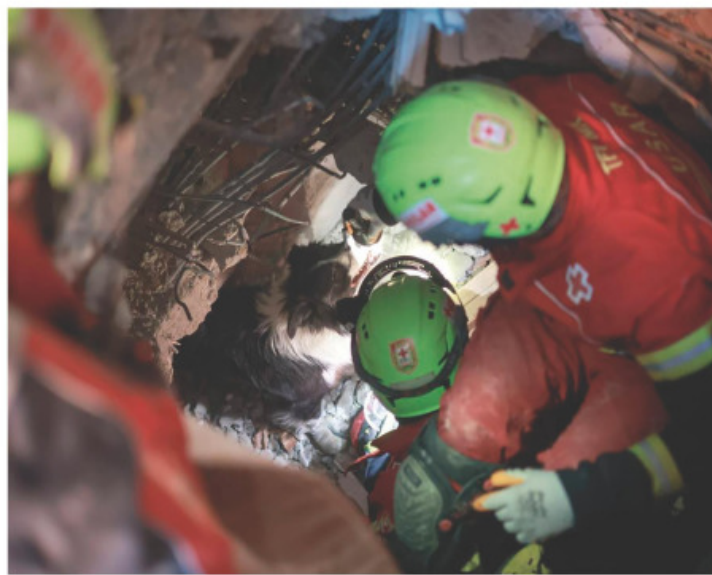
ELEMENTOS de la Cruz Roja Mexicana, ayer, con su binomio canino en un rescate.

BALAM , un border collie, ayudó a salvar a una persona; éste heredó de su padre Athos, genes de rescatista; suman 23,700 decesos