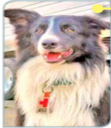
ORLY (HIJO) ESTÁ ACTIVO La Cruz Roja Mexicana lo adiestró en búsqueda y rescate en estructuras colapsadas.