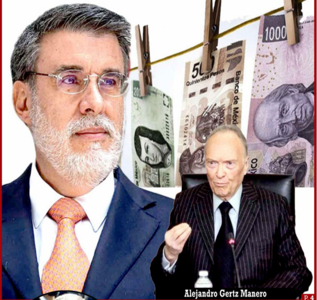
Alejandro Gertz Manero P.4