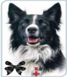
ATHOS (PAPÁ) ENVENENADO EN 2021 Participó en las labores de rescate tras el sismo del 19 de septiembre de 2017 en la CDMX.

Orly y Balam son dos canes rescatistas de la Cruz Roja Mexicana enviados a Turquía para continuar con la misión de su padre, Athos, otro perro de la institución que murió envenenado en junio de 2021. Ayer, Balam ayudó a sacar de los escombros a una persona de entre 35 y 40 años. Junto con su hermano (abajo) ha recuperado 11 cuerpos en la ciudad de Adiyaman. / 20