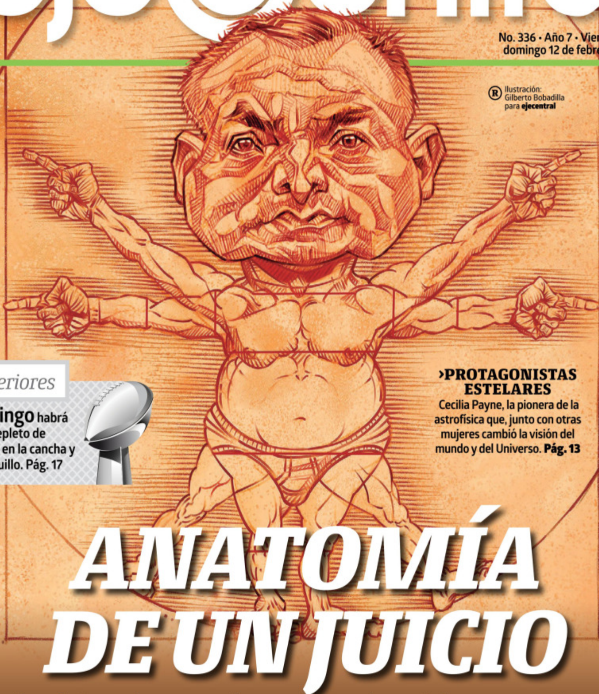
Ilustración: Gilberto Bobadilla para eje@central

No. 336 • Año 7 • Viernes 10 al domingo 12 de febrero, 2023