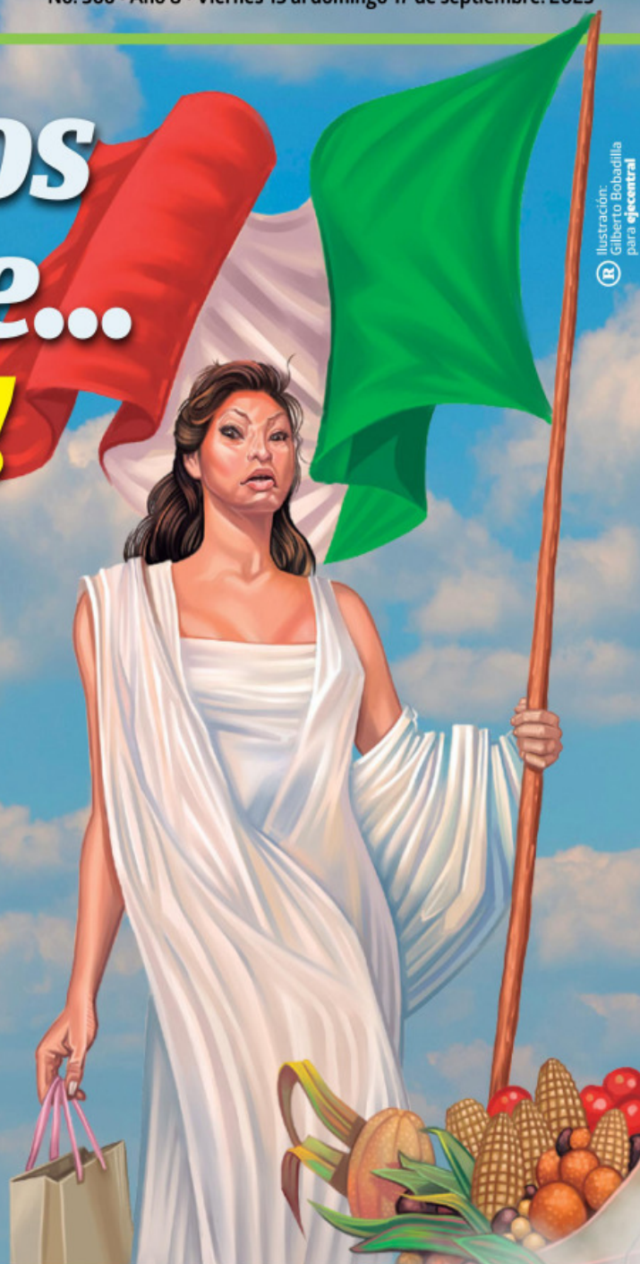
Ilustración: Gilberto Bobadilla para eje@entral