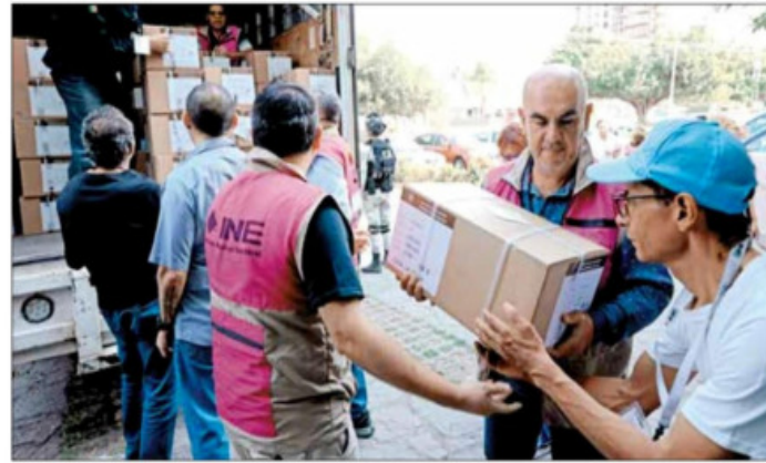
▲ Personal del INE descarga los insumos en Zapopan, Jalisco.