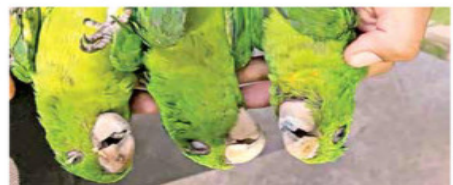
Loros y cotorros están entre las especies más afectadas por las altas temperaturas registradas en San Luis Potosí y Tamaulipas.