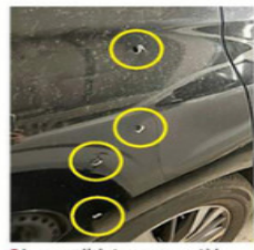
La candidata compartió fotos del vehículo atacado.

Minutos antes, la candidata había realizado un recorrido en la Colonia Peralvillo, próxima al Barrio de Tepito.