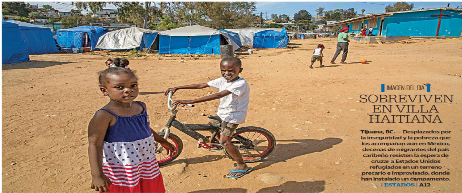
IMAGEN DEL DÍA SOBREVIVEN EN VILLA HAITIANA

Tijuana, BC. — Desplazados por la inseguridad y la pobreza que los acompañan aun en México, decenas de migrantes del país caribeño resisten la espera de cruzar a Estados Unidos refugiados en un terreno precario e improvisado, donde han instalado un campamento.