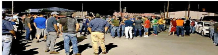
Miles de trabajadores que no han recibido salario mantienen plantones en Altos Hornos.

Organismos empresariales advierten que al menos 50 mil familias de Monclova y otros 10 municipios padecen por la suspensión de actividades de la acerera, que cesó su producción, disminuyó al mínimo sus operaciones