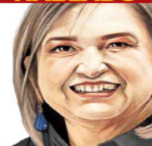
Ilustración: Honesto Sierra