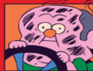
Ilustración: Cortesía Planeta

El libro Podría ser peor reúne 50 historias sobre errores épicos y hechos absurdos que ayudan a animar a los desencantados. / 18