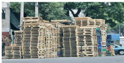
Las tarimas provocan complicaciones en la movilidad y, además, tienen un alto riesgo de incendio.