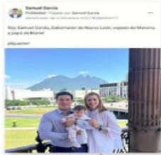
El Gobernador Samuel García, con su familia, en un momento de su campaña.

Estas cifras son adicionales a los 100 millones de pesos destinados por el Gobierno a dos contratos para promover contenidos oficiales de la Administración en plataformas digitales.