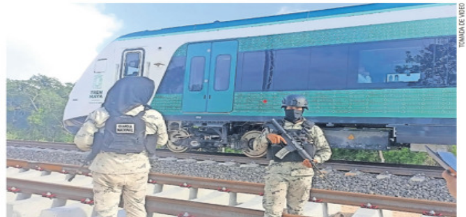
Militares custodiaron el vagón durante el tiempo que estuvo detenido. En tanto, funcionarios y directivos de empresas constructoras trataron de ayudar a que el tren retomara su curso.

Con AMLO a bordo, se descompone el Tren Maya