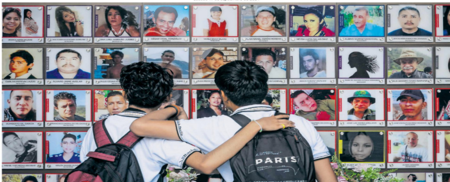
En el Palacio de Gobierno de Cuernavaca, Morelos, se encuentra un memorial de víctimas que fue instalado por colectivos de buscadoras.