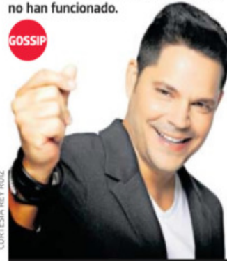
CORTESÍA REY RUIZ