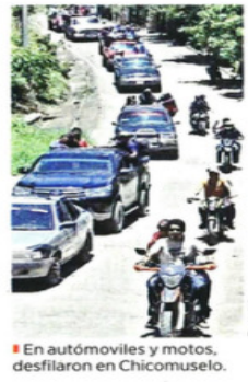
En automóviles y motos, desfilaron en Chicomuselo.