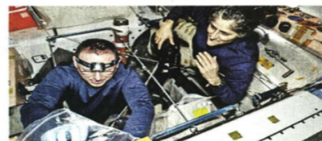
Butch Wilmore y Suni Williams están en la Estación Espacial Internacional desde principios de junio.

Starliner han generado retrasos que le han costado a la empresa unos mil 600 millones de dólares. Este fracaso se suma al del 737 Max, el avión comercial de Boeing que ha sufrido varias crisis, incluida una este año en la que un panel de una puerta de uno de los aviones se desprendió en pleno vuelo.