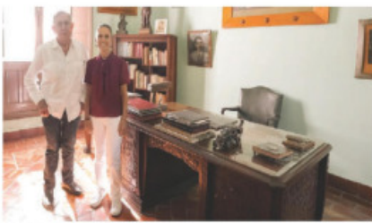
CUAUHTÉMOC Cárdenas y Claudia Sheinbaum, ayer.

EN JIQUILPAN la morenista señala que la lucha del ingeniero en 1988 fue un quiebre en la historia del país; es antecedente de su movimiento, destaca. pág. 6