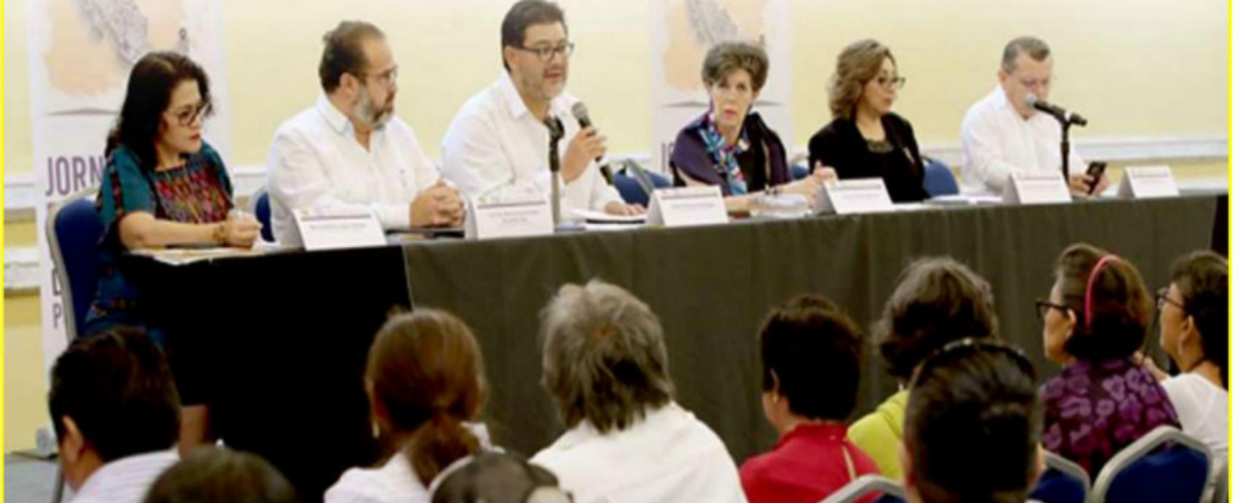
Reyes Rodríguez Mondragón y magistrados de la Sala Superior del TEPJF