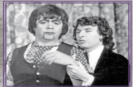
Con su personaje de Pujitos , Chabelo mostró su vena cómica en el programa La carabina de Ambrosio , junto a César Costa.

ZITA MONSERRAT MEDINA DEFRAUDÓ A 50 NUEVAS VÍCTIMAS