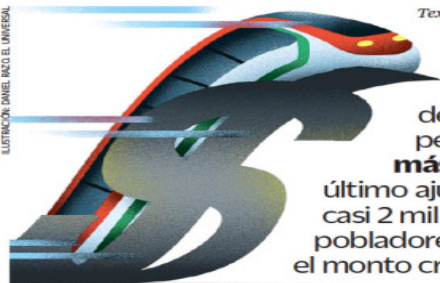
ILUSTRACIÓN: DANIEL BAZO EL UNIVERSAL

El proyecto planteaba una inversión original de 34 mil 115 millones de pesos en 2013, pero lleva más de 105 mil millones, cuyo último ajuste se dio en agosto por casi 2 mil millones ante obstáculos de pobladores, revisiones y restituciones; el monto creció más en este gobierno. | CARTERA | A20