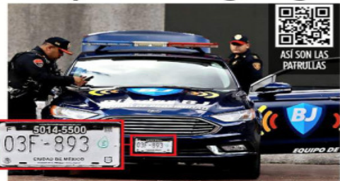
Las patrullas de BJ traen placas de auto particular.

Grupo REFORMA constató en un recorrido que una de las patrullas de Tlalpan fue usada para transportar despensas a la Alcaldía.