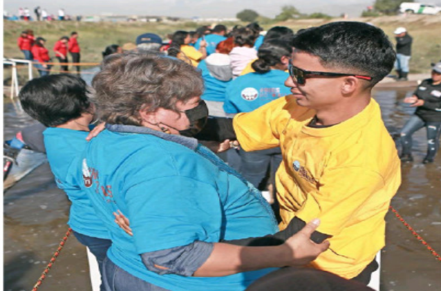
CRISTINA TORRES EL UNIVERSAL

Más de 300 familias de México y EU se unieron en la línea divisoria de Ciudad Juárez, Chihuahua, en el evento "Abrazos No Muros". | A13 |