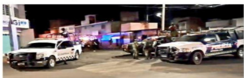
Personal militar llegó al lugar minutos después del crimen.

Testigos refieren que una de las víctimas intentó escapar, pero los sujetos le dieron alcance y le dispararon, por lo que su cuerpo quedó en el exterior del bar.