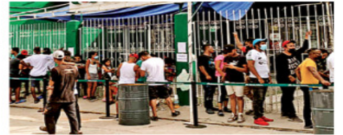
Decenas de migrantes hacen fila afuera de un banco en Tapanatepec, Oaxaca, para cambiar moneda extranjera o usar los cajeros.

Un grupo de 95 venezolanos expulsados por EU fue regresado de Tamaulipas a la CDMX, donde el gobierno local los canalizó a albergues. PRIMERA | PÁGINAS 16 Y 17