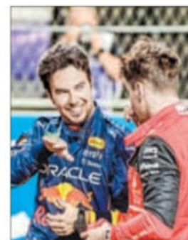
▲ Checo Pérez conversa con Charles Leclerc.