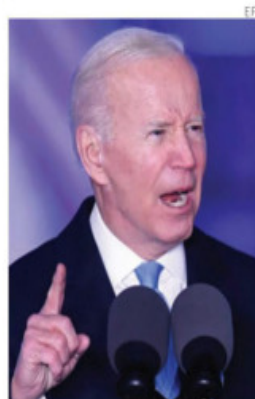
En Polonia, Biden dice que Putin no puede permanecer en el poder.

También limita apoyos a investigadores de universidades privadas y pasa por alto los criterios de calidad en becas. PAG 15