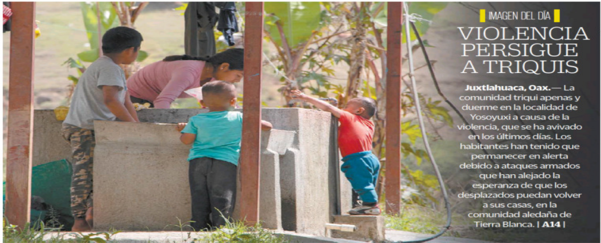
IMAGEN DEL DÍA VIOLENCIA PERSIGUE A TRIQUIS

Sergio Pérez obtiene la pole en el segundo Gran Premio de la temporada; es el único mexicano en lograrlo en Fórmula Uno. | B1 |