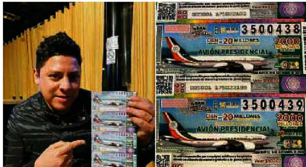
Ricardo Gallardo, diputado federal

Orgullo y admiración es lo que desde este espacio expresamos a nuestras compañeras que día con día se encargan de hacer posible que esta casa editorial mantenga el liderazgo periodístico en el país. Todas solidarias con el paro. Algunas con su ausencia mostraron su indignación. Otras, igual de indignadas, decidieron apoyar esta histórica jornada precisamente dándole visibilidad y cobertura periodística. Y una más del equipo, desde la cama de un hospital en donde se recupera de las quemaduras causadas por una bomba molotov que le estalló cerca cuando cubría las protestas del domingo pasado. Nuestro respeto y reconocimiento para todas siempre.