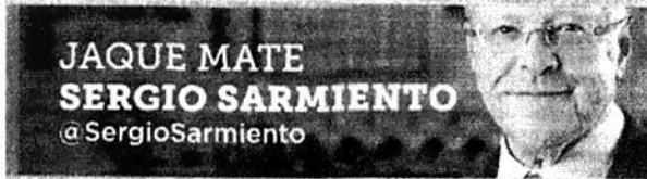
JAQUE MATE SERGIO SARMIENTO @SergioSarmiento

López Obrador no debería usar recursos públicos para impulsar un culto a su personalidad, no es ético y está prohibido.