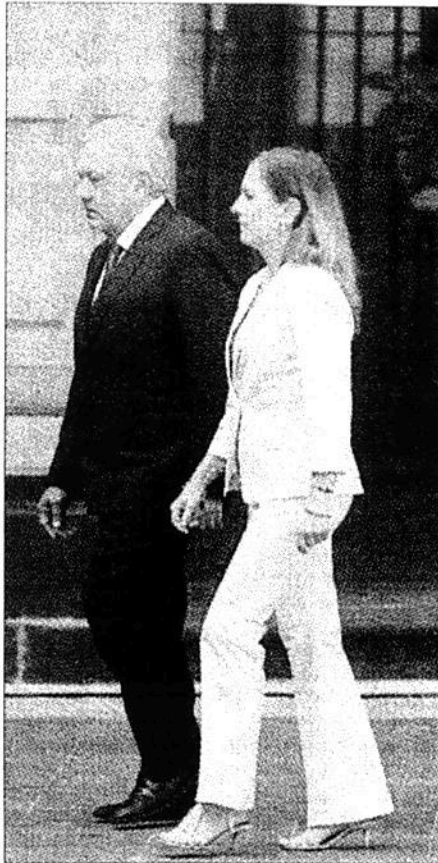
▲ El presidente Andrés Manuel López Obrador acudió al patio central del Palacio Nacional acompañado por su esposa, Beatriz Gutiérrez Müller, para presentar ante gobernadores, líderes empresariales y de las cámaras de Diputados y Senadores e invitados especiales el Informe de Gobierno de los primeros 100 días de su administración.