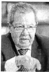
Porfirio Muñoz Ledo