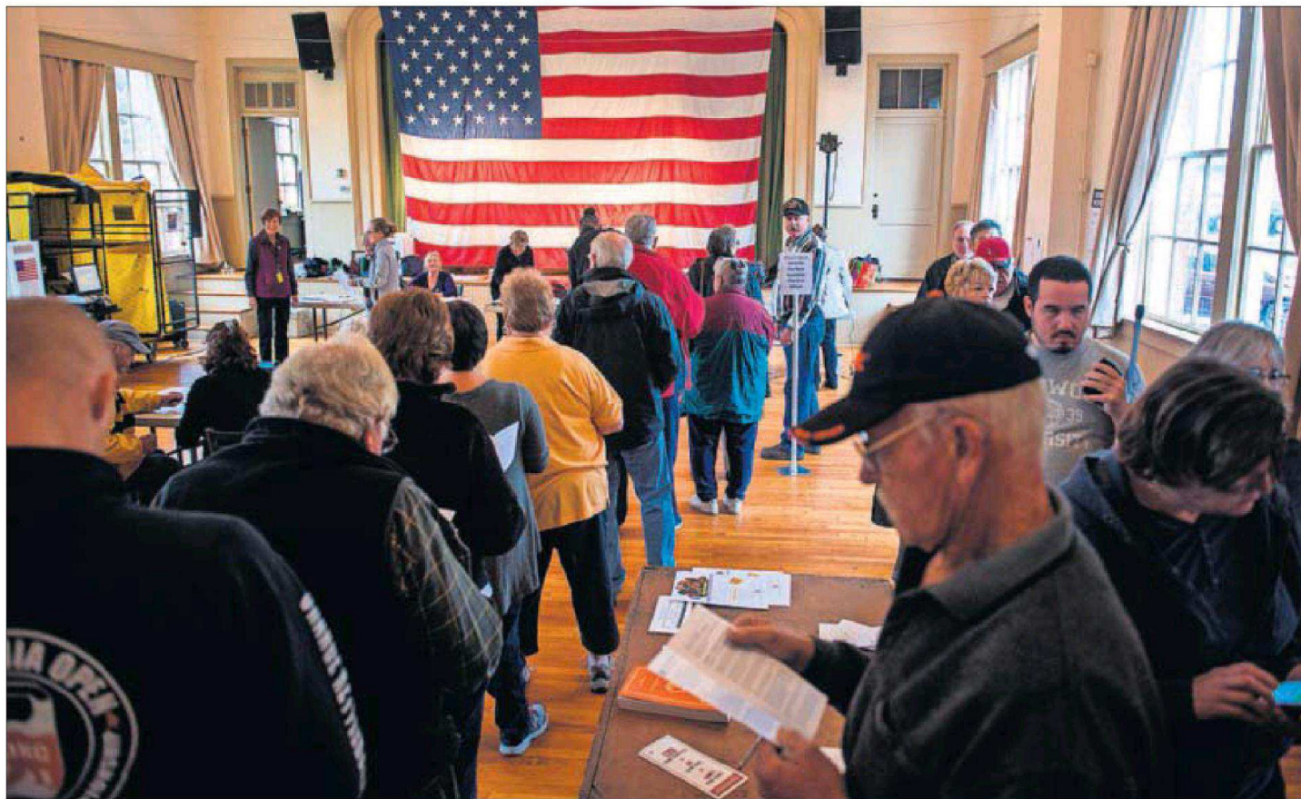
Votantes hacen fila ayer en un colegio de Hillsboro (Virginia) para depositar su papeleta.

La caravana migrante habla desde México del futuro electoral del vecino del Norte