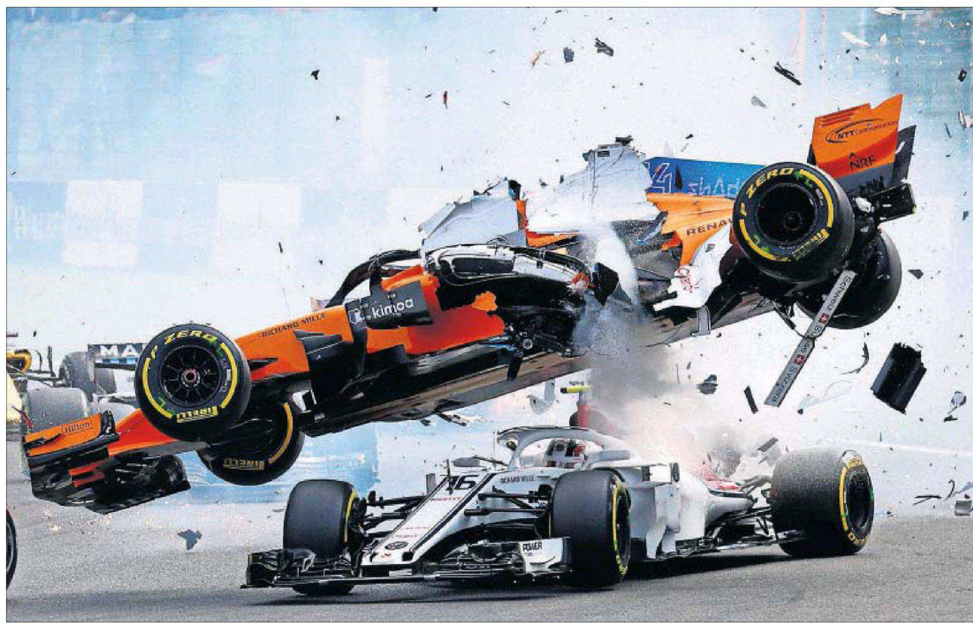
FERNANDO ALONSO VUELA EN SPA. Un toque por detrás de Hülkenberg en la salida del GP de Bélgica de F-1 provocó que el McLaren de Fernando Alonso saltara por los aires, golpeando en su caída al Sauber de Leclerc, al que salvó el arco de seguridad. PÁGINA 32