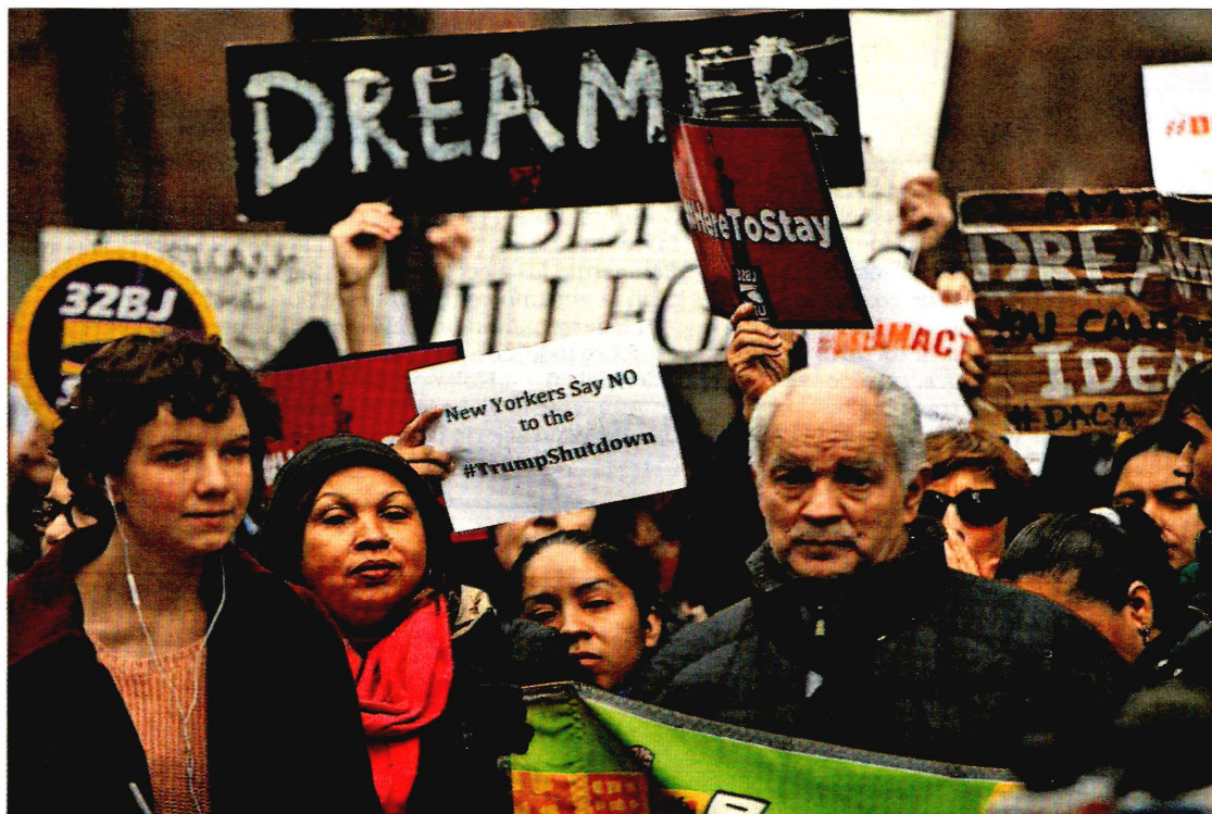
Manifestación en contra de las políticas migratorias de Trump, ayer en Nueva York.

El centro del PSG, perdido sin Thiago Motta P32