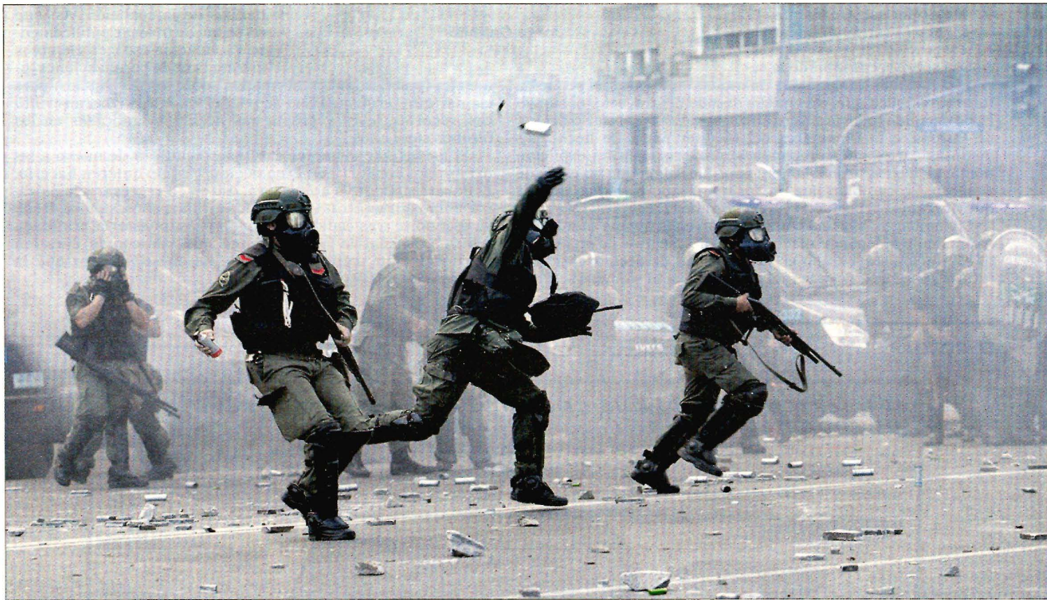
LOS DISTURBIOS OBLIGAN A SUSPENDER LA REFORMA DE LAS PENSIONES EN ARGENTINA. Pese a que el presidente argentino, Mauricio Macri, tenía los votos suficientes en el Congreso para aprobar la polémica reforma de las pensiones, enormes disturbios frente al edificio y una bronca interna obligaron ayer a suspender la sesión. En la foto, antidisturbios lanzan botes de humo contra los manifestantes. P7

ROBERTO AZEVÊDO Director general de la OMC “Las medidas proteccionistas crean un efecto dominó”