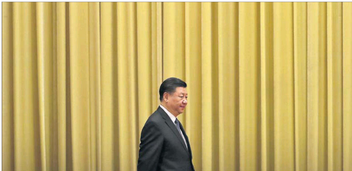
CHINA AVISA DE QUE USARÁ LA FUERZA SI TAIWÁN INTENTA FORMALIZAR SU INDEPENDENCIA. El presidente chino, Xi Jinping, advirtió ayer a Taiwán de que la reunificación es inevitable y que no descarta usar la fuerza si la isla intenta formalizar su independencia. PÁGINA 2