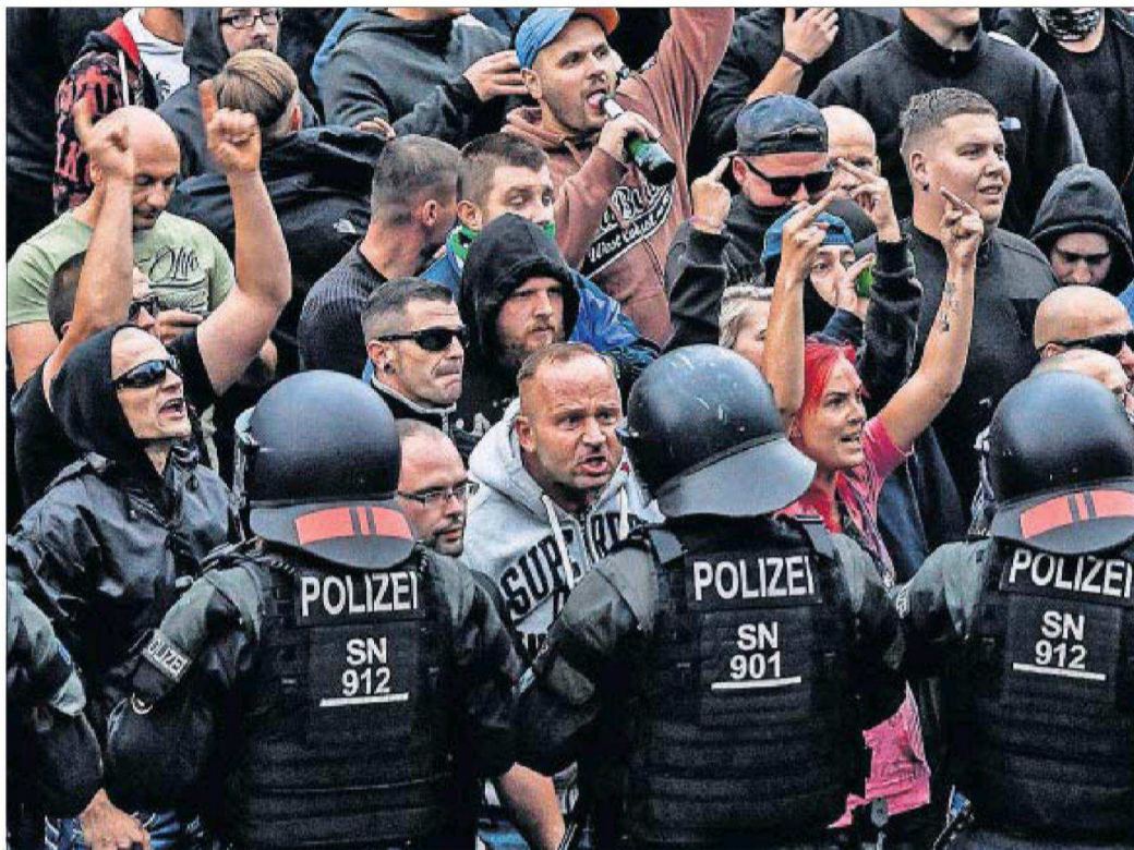
FILIP SINGER (EFE)

EL PAÍS publica entre hoy y mañana La resolución , uno de los cuentos policíacos póstumos del autor argentino, fallecido en 2017. PÁGINAS 19 A 21