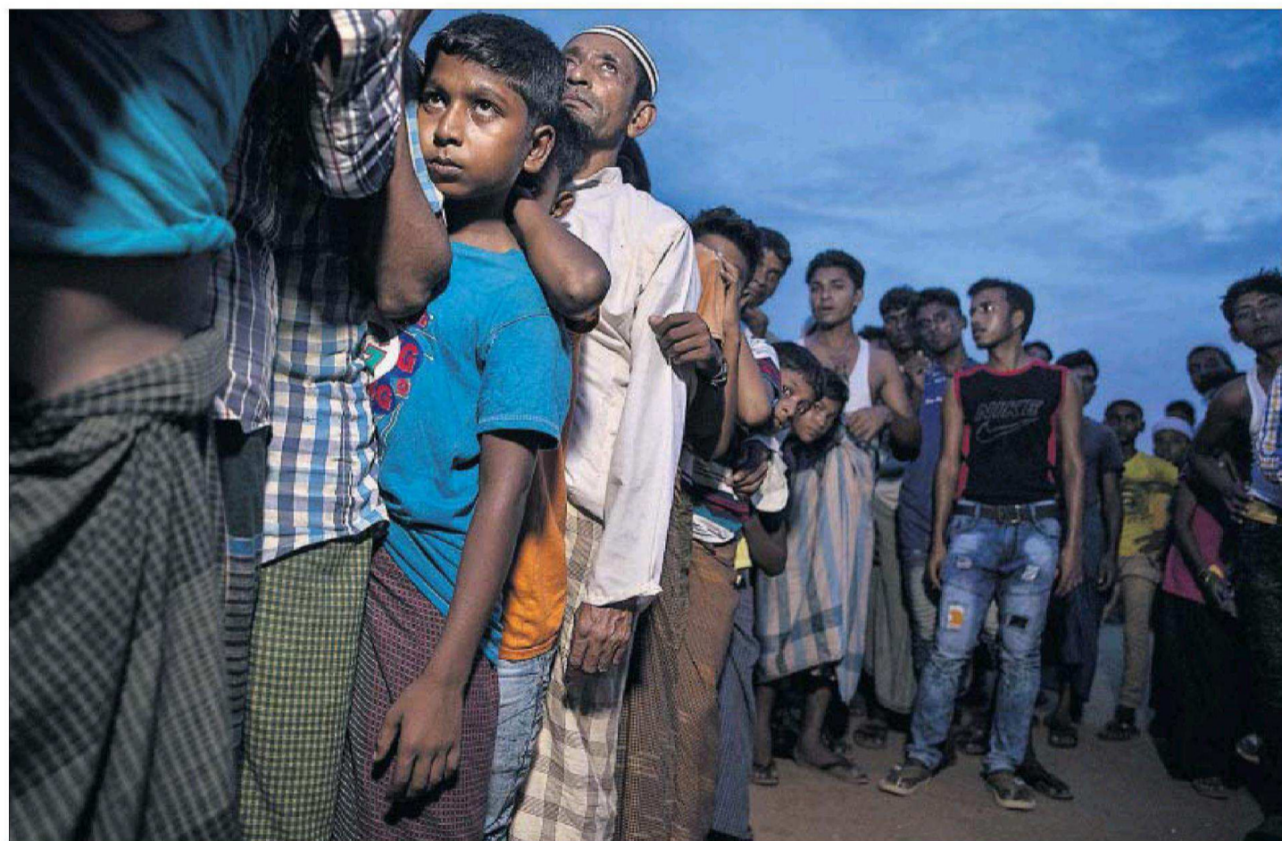
LA ONU CALIFICA DE INTENTO DE GENOCIDIO LA PERSECUCIÓN A LOS ROHINYÁS. Un informe presentado ayer por Naciones Unidas concluye que "la cúpula militar de Myanmar tenía intención genocida" al perseguir a esta minoría musulmana. P6