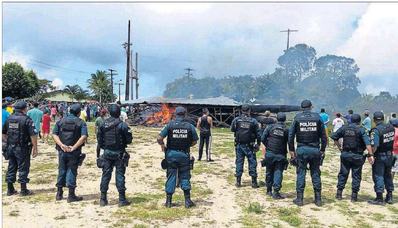
Policías brasileños vigilan la zona de Paracaima donde el sábado se registraron incidentes contra inmigrantes venezolanos.