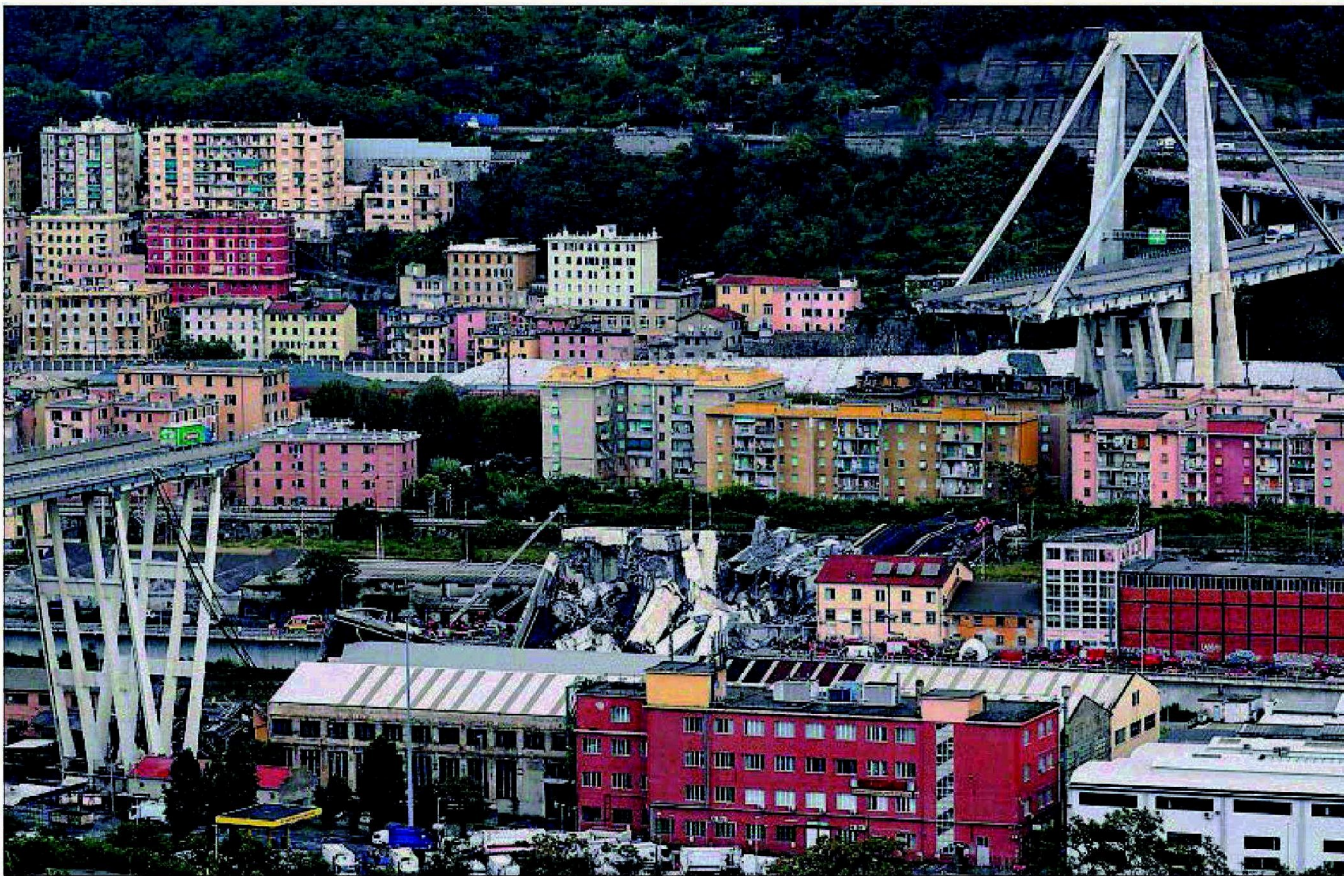
Tramo del puente que se desplomó ayer en Génova.